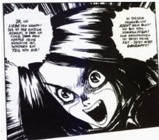
Feminismus Grundkurs, Lektion 1: Jungdemokratische SV-Aktivistin in der Schulkonferenz