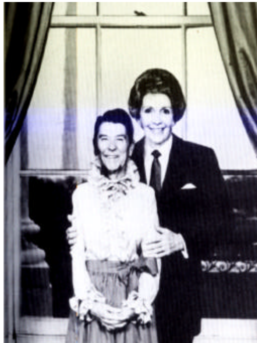
„...and i am president.“

schüler à la „das ist nichts für Mädchen“ sich den Stoff anzueignen, zum anderen aber auch dazu, dass über die „Mädchen-Kurse“ abwertend gelästert wird oder aber Lehrer, die meinen, dass Physik und Mathe nichts für Mädchen seien, Mädchen-Kurse auf einem niedrigeren Niveau unterrichten. Eine Gesamtschule in Bergisch-Gladbach hat sehr gute Erfahrungen mit „Binnen-Trennung“ gemacht: In Chemie saßen Schülerinnen und Schüler zwar im selben Raum, aber an jeweils Jungen- bzw. Mädchentischen. So wird verhindert, dass nur die Jungen die Experimente