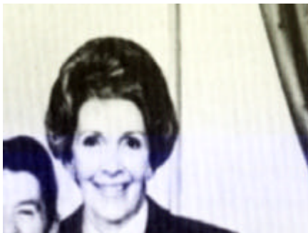
English compact course, lesson 1: „Hello, my name is Nancy...“

Unter Koedukation versteht man das gemeinsame Unterrichten von Mädchen und Jungen, das seit 1965 in der BRD zur Regel wurde. Auf der einen Seite war die Durchsetzung der koedukativen Schule als Regeleschule der erste Schritt zur Auflösung der traditionell geschlechterspezifischen Bildung, auf der anderen Seite brachte sie auch Probleme mit sich. Dies ist auch nicht verwunderlich, da, wie so oft, nicht emanzipatorische Überlegungen im Vordergrund standen sondern vielmehr finanzpolitische Aspekte den Ausschlag gaben. Abgesehen davon existieren